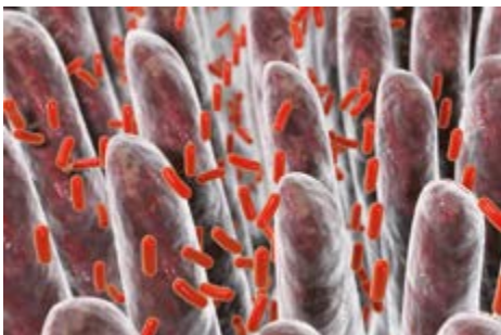
Diverse Bakterienansammlungen auf der Darmsoberfläche 3-D-Illustration,

Eine weitere nennenswerte funktionelle Gruppe sind die Equolbildner (z. B. Adlercreutzia spp., Eggerthella spp., Slackia spp.). Sie sind in der Lage, aus dem Isoflavon Daidzein (v. a. aus Soja) das nicht-steroidale Östrogen Equol herzustellen. Equol kann an die Östrogenrezeptoren ER \alpha und ER \beta binden und fördert die Bildung des Sexualhormonbindenden-Globulins (SHBG). Darüber hinaus hat es antioxidative, immunstimulierende und entzündungshemmende Eigenschaften, unterstützt beim Schutz vor Osteoporose, Herzerkrankungen, peripheren Durchblutungsstörungen, stärkt die kognitiven